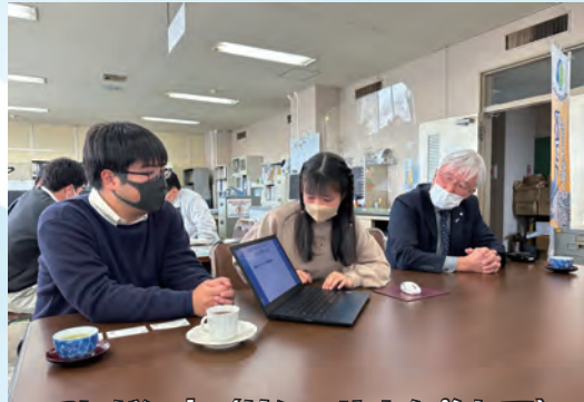
プレゼン中 (リハーサルも兼ねて)