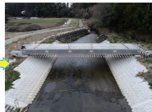
6本設置完了（上流から）