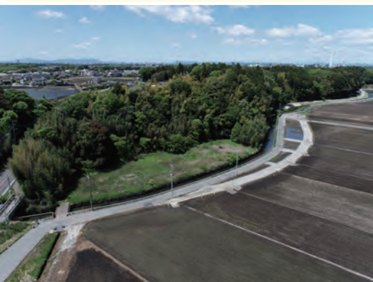
下流上空から撮影