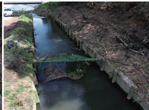
葉や小枝の流出防止のネット