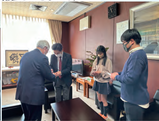
みんなで市長と名刺交換