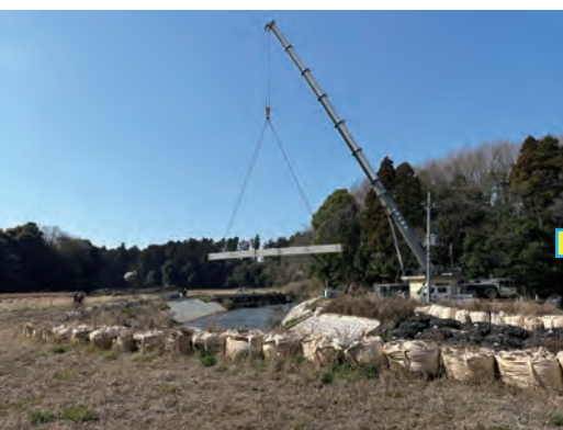
桁の設置初め（吊り）