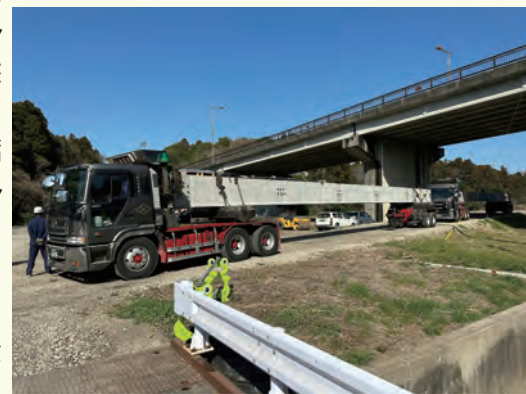
【大型特殊トレーラーで運搬】

橋梁名：無名橋（完了後は新宮田橋） 施工日：令和5年3月22日、23日（2日間） 受注者：株式会社 大曽根建設