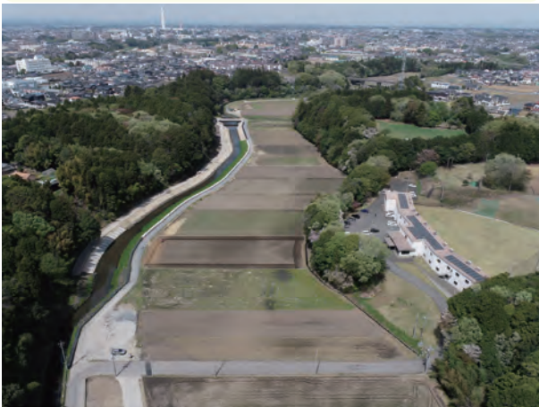
上空からの工事区間写真

一級河川大川の無名橋（新宮田橋）から柴田橋の区間の河川改修工事を令和4年度に引き続き行っています。現在は、河道を拡幅するために山側の樹木の伐採と伐根を行っています。大川に樹木が