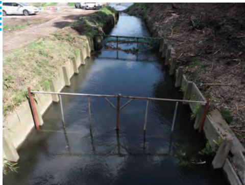
樹木流出防止のスクリーン