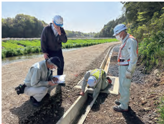
構造物の延長検測