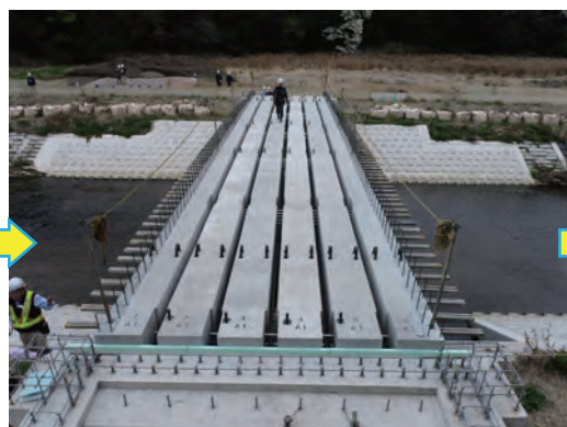
6本設置完了（右岸から）