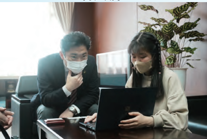
泉輝さんが回答し説明！