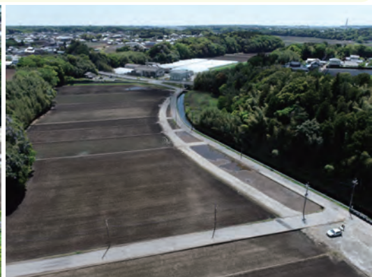
上流上空から撮影