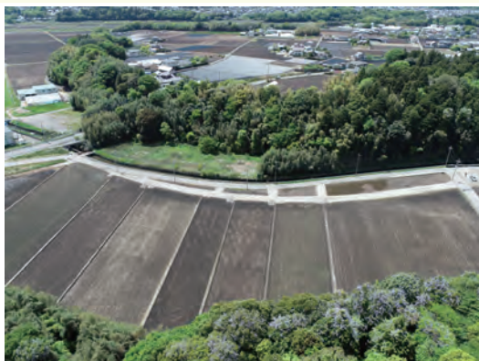
左岸上空から撮影