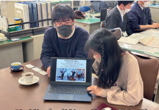
プレゼン中 (リハーサルも兼ねて)