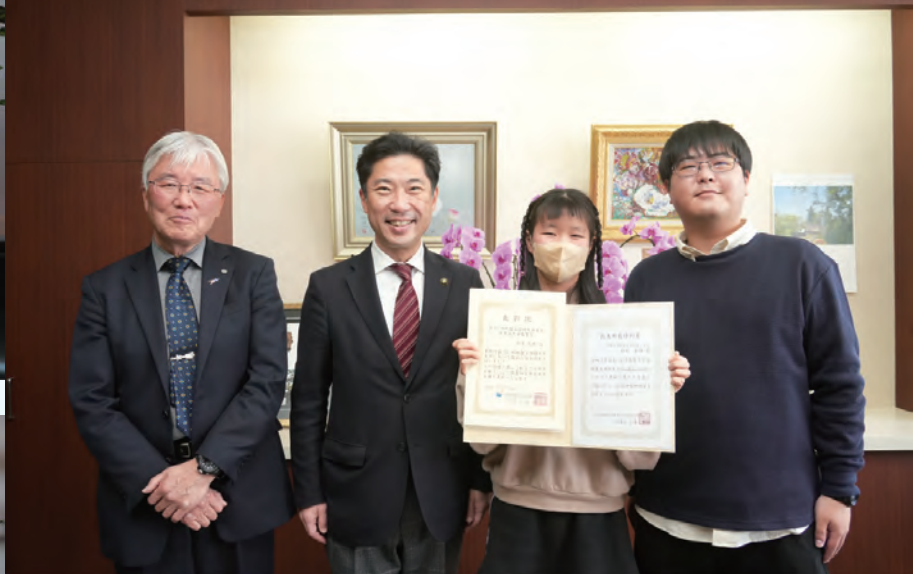
最後は、みんなで記念撮影